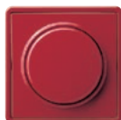
A Rot (ähnl. RAL 3003)