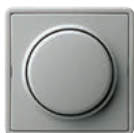
A Grau (ähnl. RAL 7038)