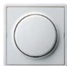
A Reinweiß (ähnl. RAL 9010)