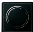
A Schwarz (ähnl. RAL 9005)