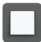
Dunkelgrau Soft-Touch (ähnl. NCS S 7000-N)