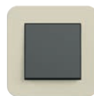
Sand Soft-Touch (ähnl. NCS S 2005-Y20R)