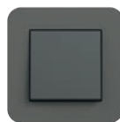
Dunkelgrau Soft-Touch (ähnl. NCS S 7000-N)