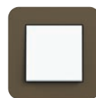
Umbra Soft-Touch (ähnl. NCS S 7010-Y10R)