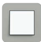
Grau Soft-Touch (ähnl. NCS S 3500-N)