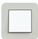
Hellgrau Soft-Touch (ähnl. NCS S 2000-N)