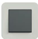
Hellgrau Soft-Touch (ähnl. NCS S 2000-N)