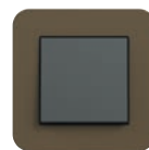
Umbra Soft-Touch (ähnl. NCS S 7010-Y10R)