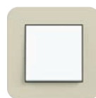
Sand Soft-Touch (ähnl. NCS S 2005-Y20R)